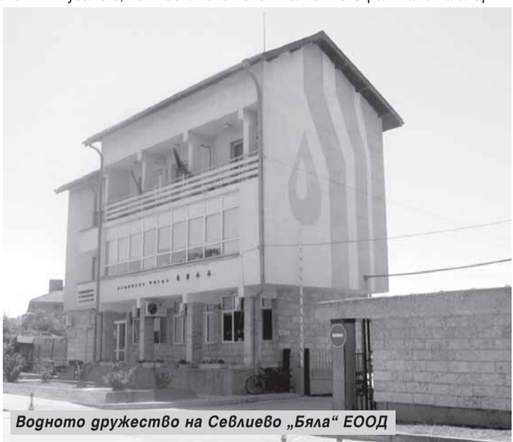
Водното дружество на Севлиево „Бяла“ ЕООД

на вода и качествена услуга. Трябва да се мисли и за интересите на екипа на „Бяла“ ЕООД, повтарям, че тези които са свързани с ВиК сектора нищо не губят, те просто се прехвърлят юридически към ВиК Габрово. Иначе си остават в Севлиево и продължават да се занимават с дейността си, включително и отстраняване на аварии.